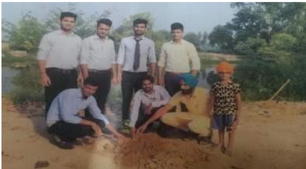
Volunteers plant the Tree during this Tree Plantation Drive