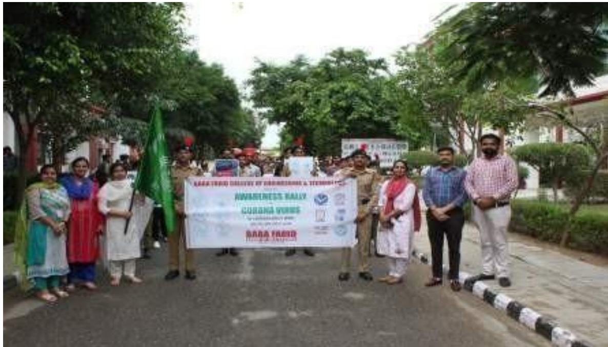
Principal, BFCET raised the flag of Awareness Rally on Corona Virus