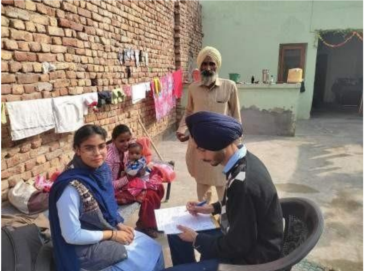
Glimpses of Village cum Household Survey under Unnat Bharat Abhyaan