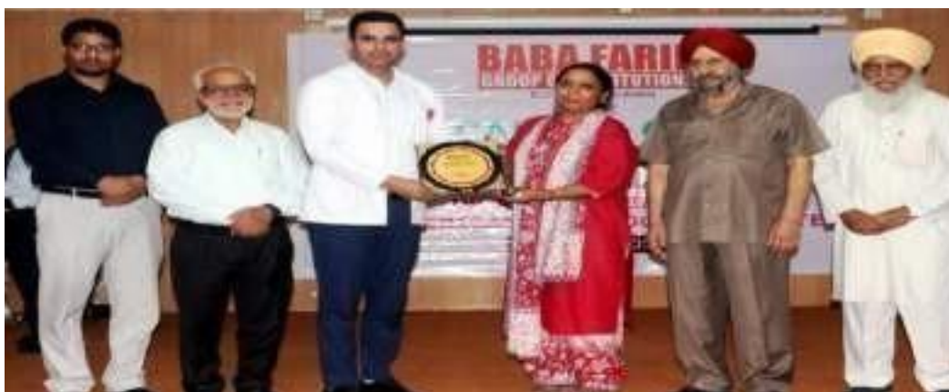
A Glimpse of Cancer Checkup and Awareness Camp