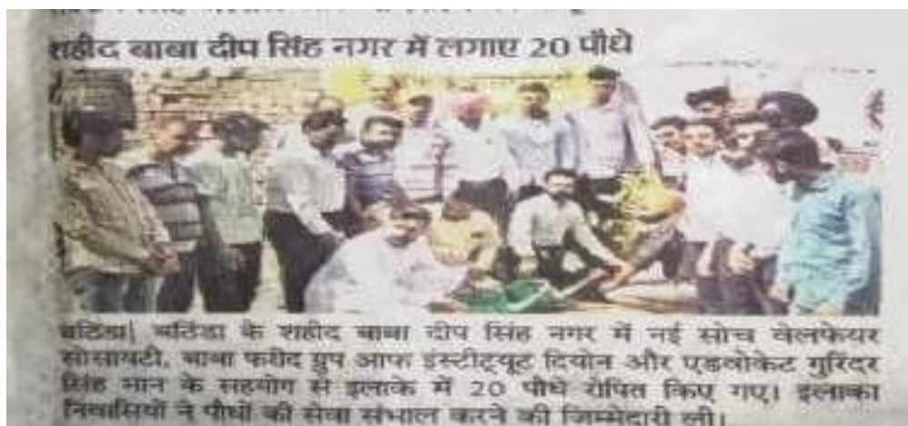
Media coverage of the event 'Greening Our Environment: A Tree-Planting Initiative'