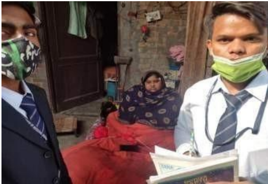
Glimpses of Village Survey under Unnat Bharat Abhyaan