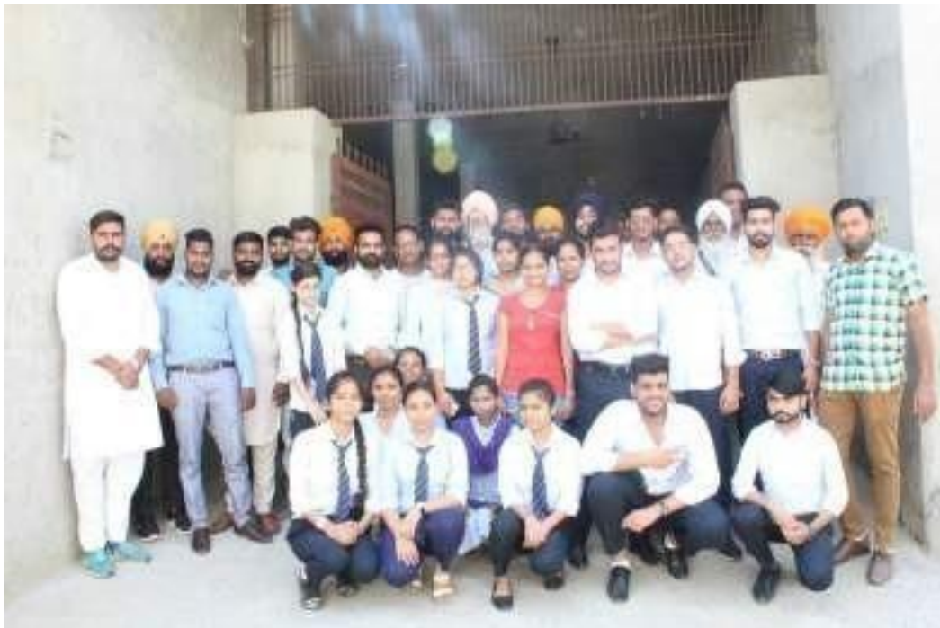
Volunteers Students with Club members & residents

Number of Local Residents Participated: 17