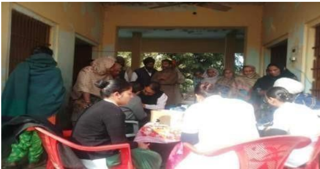
A team of doctors attending the patients during Health awareness camp