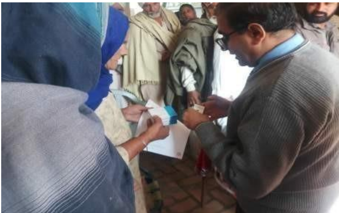
Villagers took benefit by getting the advice from the Doctors along with the Medical Kits in a Health awareness camp