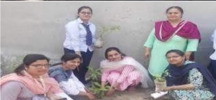
A Glimpse of One Day Eco Restoration Camp