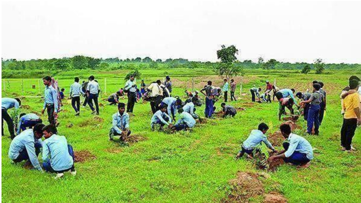
NSS/NCC volunteers during Tree Plantation at Village Deon