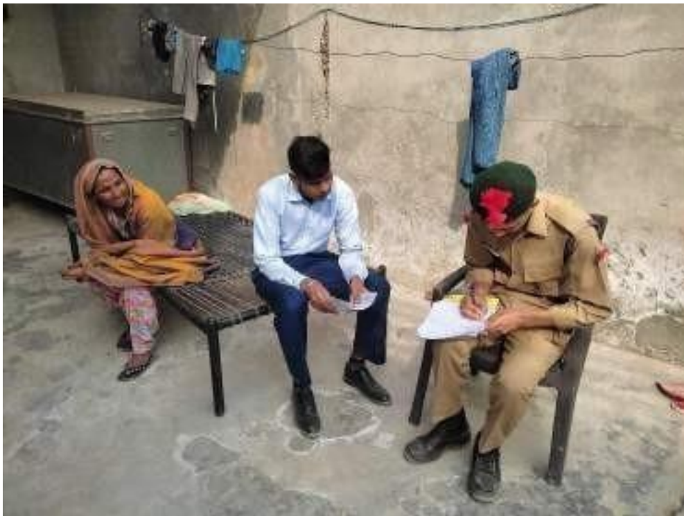
Glimpse of Household Survey under Unnat Bharat Abhyaan