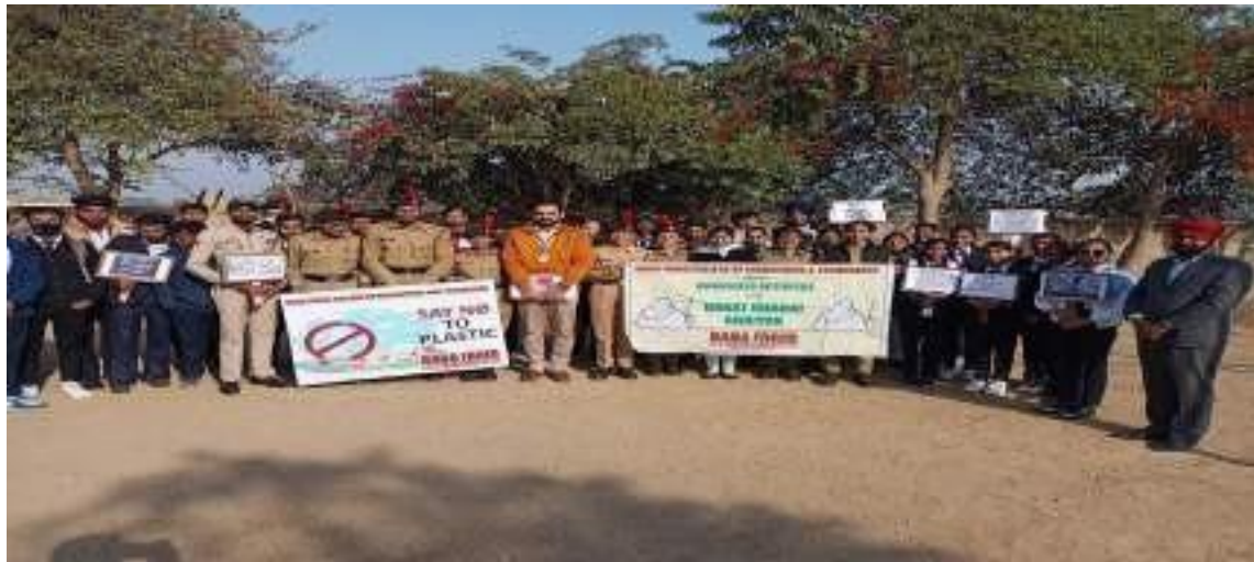
Glimpses of Awareness Rally on Say No to Plastic