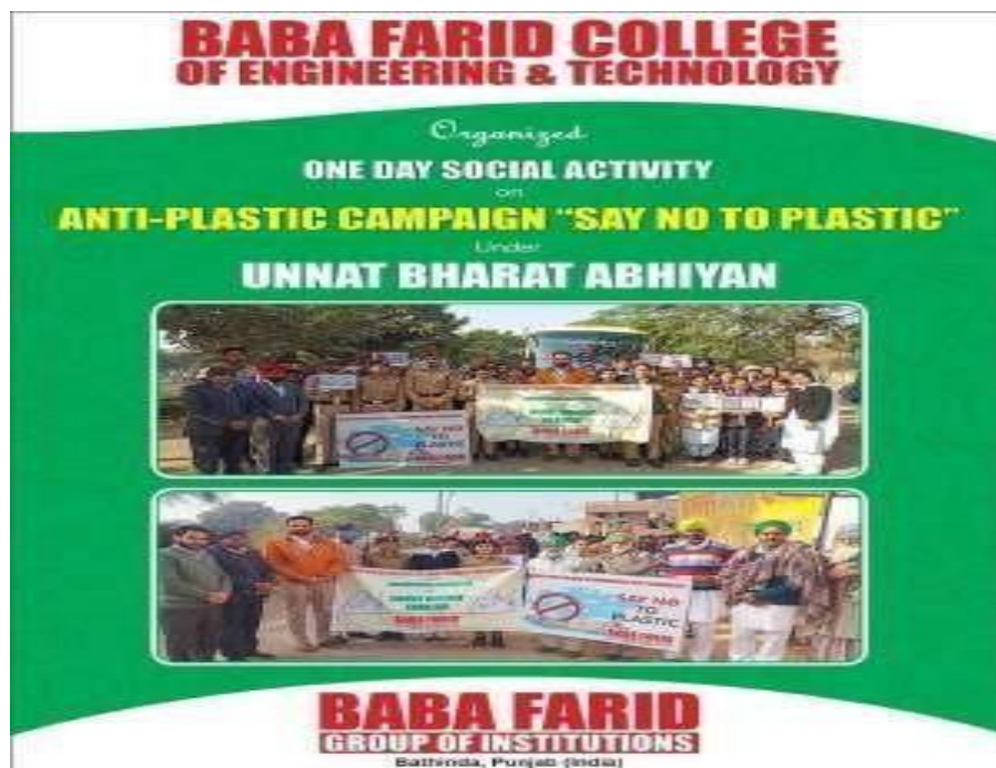
Social Media Post of Awareness Rally on Say No to Plastic