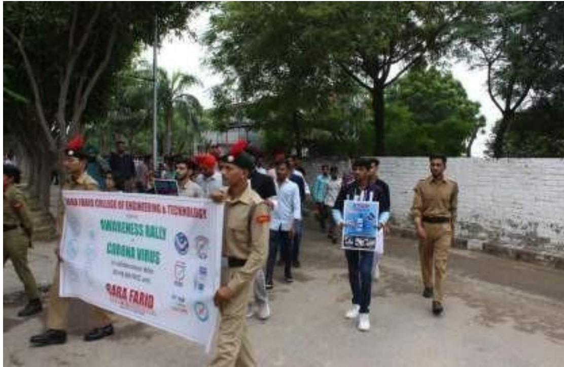
A glimpse of Awareness Rally against Corona Virus