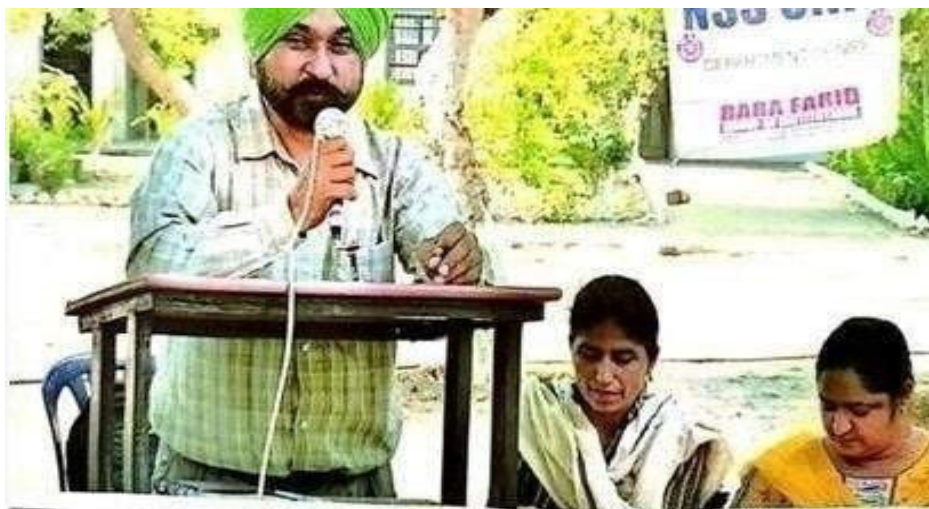
Glimpse of Anti-Drug Awareness Seminar