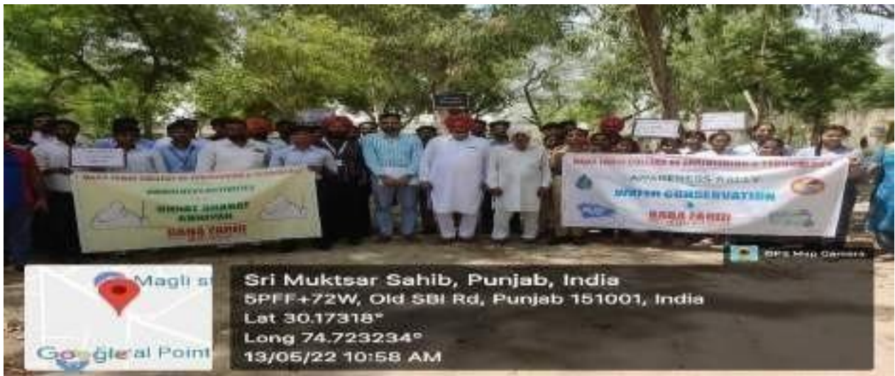
Awareness Rally on Water Conservation in Village Peori