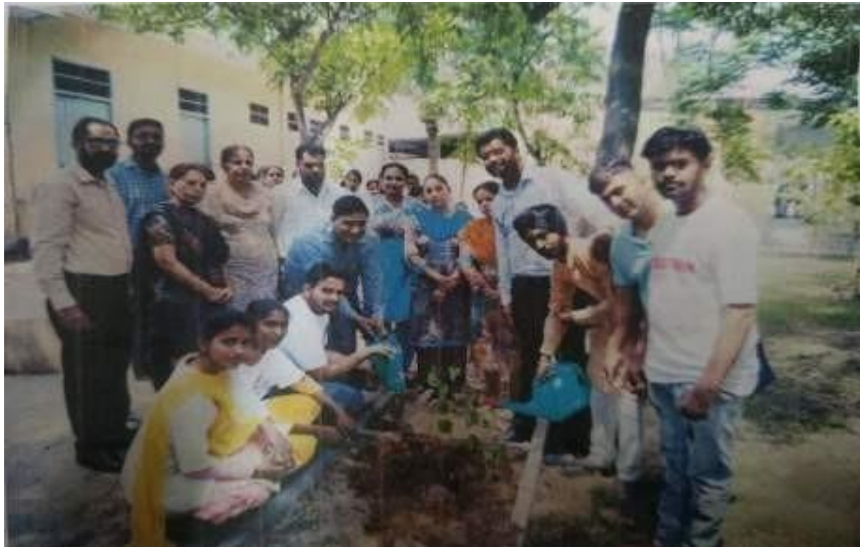
Volunteers plant trees at Govt. Sen. Sec. School, Bhupal in the presence of School Staff