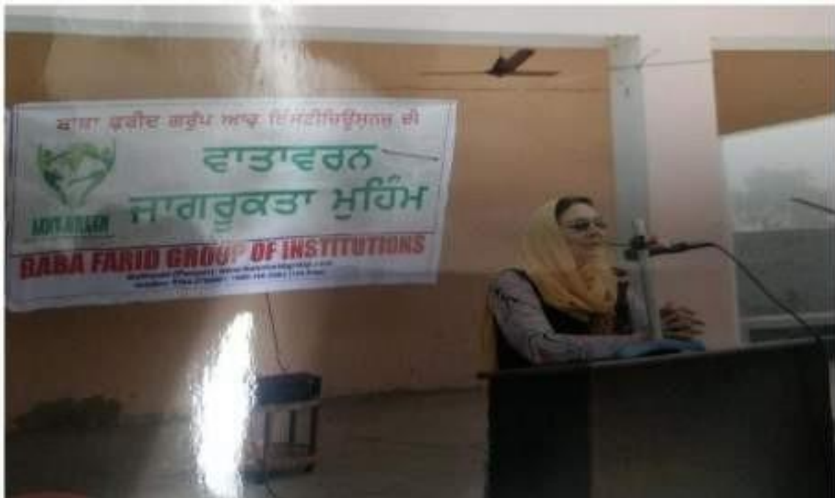
Sanitation Awareness Seminar at Village Kot Bhai: Speaker interacting with the audience during this Awareness Seminar