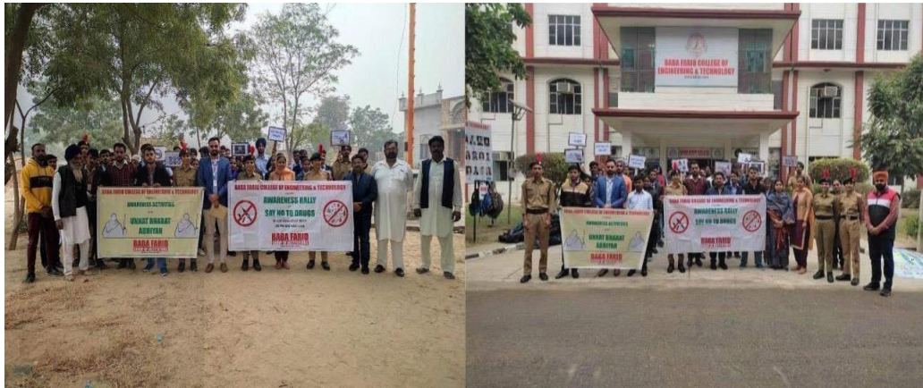
A Glimpse of Awareness Rally on ‘Say No to Drugs’