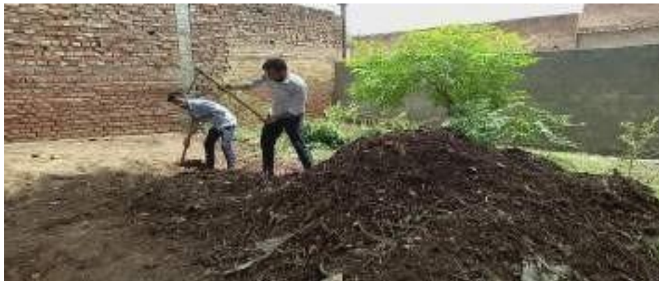
One Day Cleanliness Drive at Village Bhokhra: Volunteers clean the surroundings