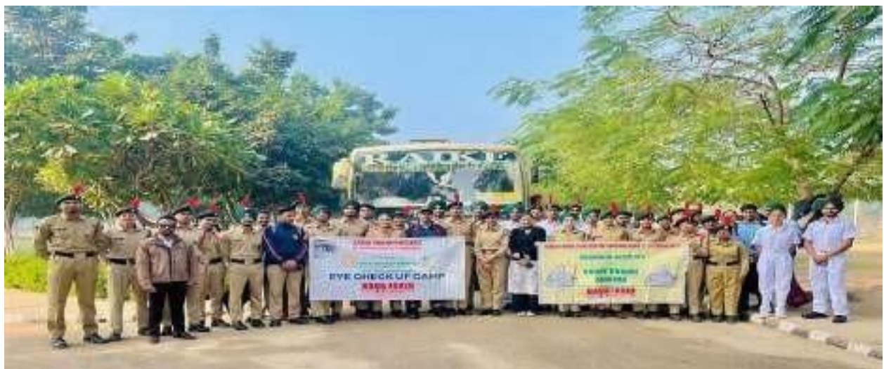
Group Photo of Volunteers