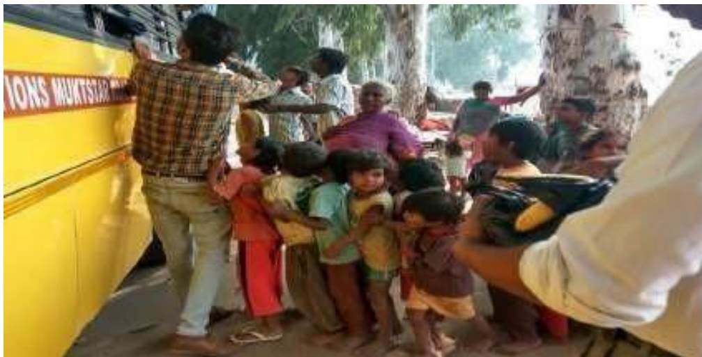
Cloth Distribution in the Slum Areas: Children Getting the Clothes