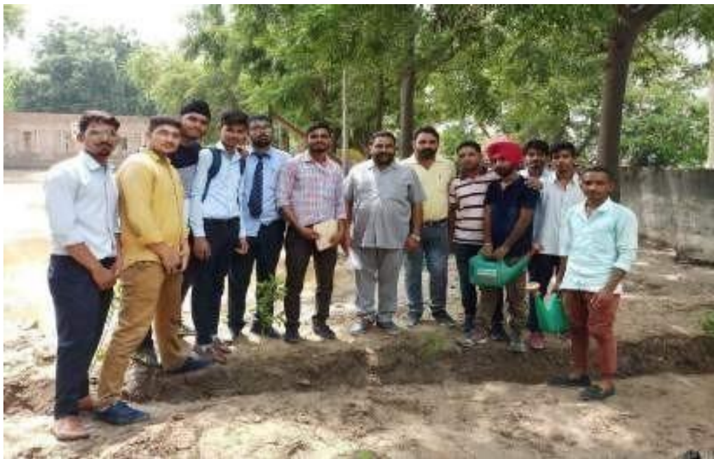
Volunteers during Tree Plantation at Village SanguDhoun