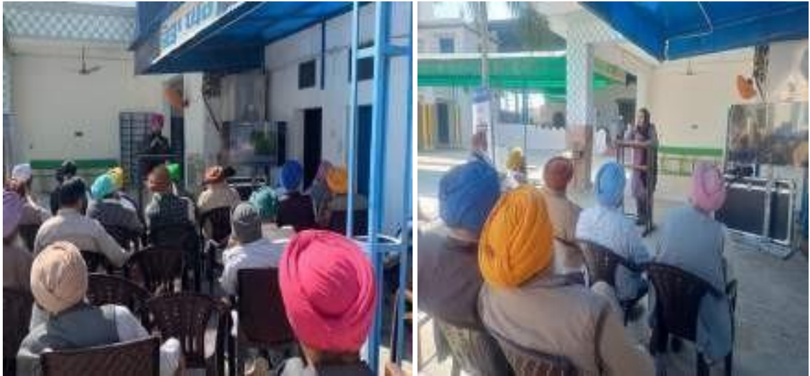
Glimpses of Awareness on Public Concerns