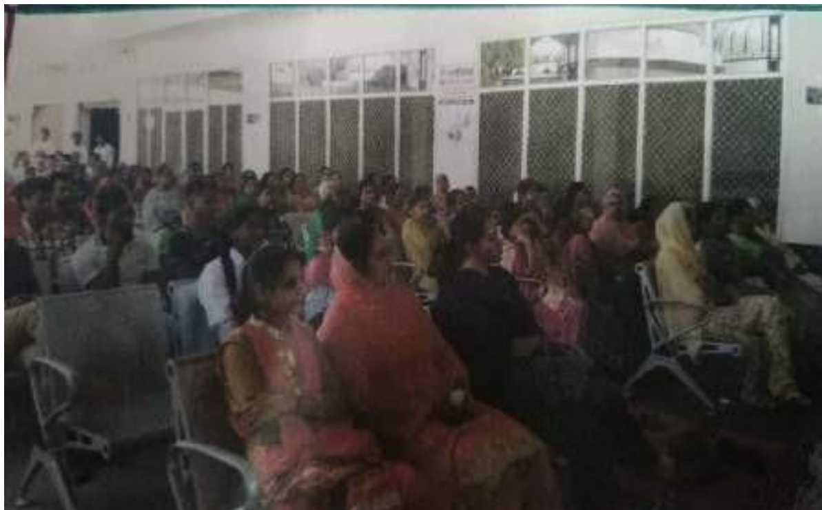
Resident of Village Bhupal during Anti-Drug Awareness and Illicit Trafficking Seminar