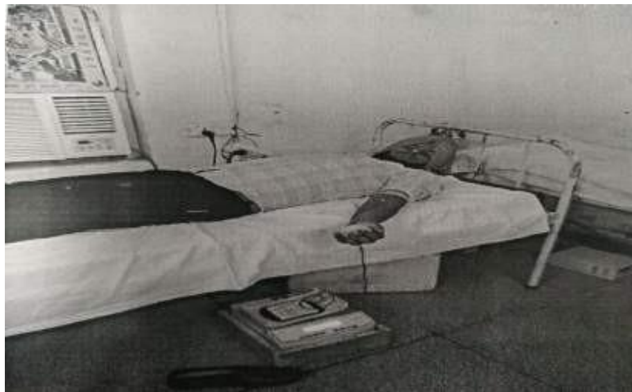
Glimpses of Blood Donation Camp