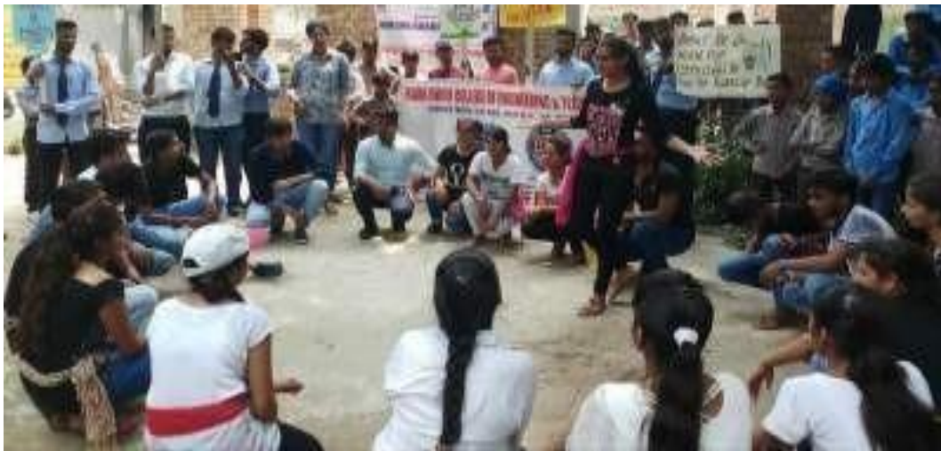
NCC Volunteers playing a Nukkad Natak to focus on the need of maintaining Swachhta at Govt. Sen. Sec. School, Deon