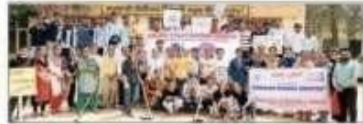
ਸਰਕਾਰੀ ਸਕੂਲ ਦੀ ਸਫਾਈ ਕਰਦੇ ਹੋਏ ਬਾਬਾ ਫਰੀਦ ਗੁਪ ਕੇ ਵਿਦਿਆਰਥੀ।

ਬਠਿੰਡਾ (ਸਾਂਡੀਆ) - ਸਵੱਛ ਭਾਰਤ ਕੇ ਲਿਫ਼ ਵੇਸ਼ ਭਰ ਮੇਂ ਯੁਵਭੀ ਕੋ ਕੋਠਨੇ ਔਰ ਊਨਕੇ ਟੂਨਰ ਔਰ ਵਿਕਾਸ ਕੇ ਲਿਫ਼ ਭਾਰਤ ਸਰਕਾਰ ਨੇ ਸਵੱਛ ਭਾਰਤ ਸਮਰ ਇੰਟਰਨੈਸ਼ਿਪ '100 ਘੰਟੇ ਦੀ ਸਵੱਛਤਾ' ਸੁਫਿਮ ਸ਼ੁਰੂ ਕੀ ਗਈ। ਇਸ ਸੁਫਿਮ ਮੇਂ ਸਭਸੇਂ ਸ਼ਕਤੀਮਾਨ ਹੈ, ਜਿਸਕੀ ਭਾਰਤ ਕੇ ਟਰ ਯੁਵਭੀ ਕੋ ਯੋਗਦਾਨ ਹੈ। ਇਸ ਪ੍ਰੋਗਰਾਮ ਕਾ ਊਦੇਯ 31 ਜੁਲਾਈ 2018 ਤਕ 100 ਘੰਟੇ ਲਗਕਰ ਫ਼ਾਰਮੀਯ ਖੇਤ ਮੇਂ ਸਮਾਜ ਸੇਵਾ ਕੇ ਲਿਫ਼ ਯੁਵਭੀ ਕੋ ਕੋਠਨੇ ਔਰ ਇਸ ਸਵੱਛਤਾ ਕਾਰਿ ਕੇ ਲਿਫ਼ ਮਹਾਤਮਯ ਯੋਗਦਾਨ ਦੇਣ ਹੈ। ਬਾਬਾ ਫਰੀਦ ਕਾਲਜ ਆਫ਼ ਇੰਜੀਨੀਅਰਿੰਗ ਐਂਡ ਟੈਕਨਾਲੋਜੀ ਕੇ 160 ਤੋਂ ਅਧਿਕ ਵਿਦਿਆਰਥੀਆਂ ਨੇ ਆਪਣਾ ਨਾਮ ਇਸ ਸਵੱਛ ਭਾਰਤ ਸਮਰ ਇੰਟਰਨੈਸ਼ਿਪ ਕੇ ਲਿਫ਼ ਫਰਮ ਕਰਵਾਏ ਹੈ। ਪ੍ਰਯੋਕ ਵਿਦਿਆਰਥੀ ਨੇ ਆਪਣੇ ਸਾਰਥਿਕ ਯਤਨ ਔਰ ਟੈਕਨੋਲੋਜੀ ਕੋ ਸਕਰਾਮਕ ਢੰਗ ਕੇ ਸਾਥ ਆਪਣਾ ਕਰ ਵੱਧ ਮਿਸ਼ਨ ਮੇਂ ਆਪਣਾ ਯੋਗਦਾਨ ਦੇਣੇ ਕੀ ਕਸਮ ਊਠਾਈ।