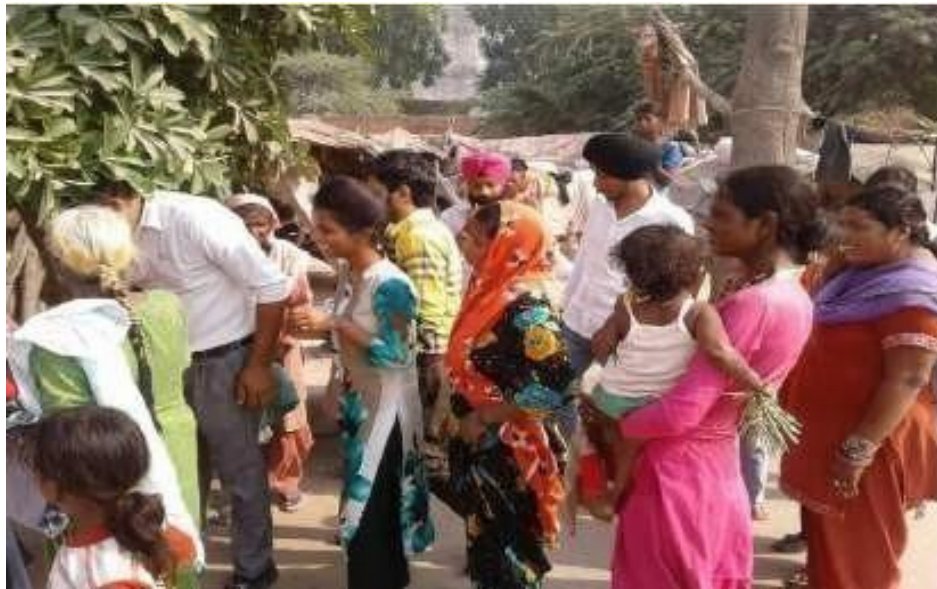
Distribution of Clothes to the Slum Dwells