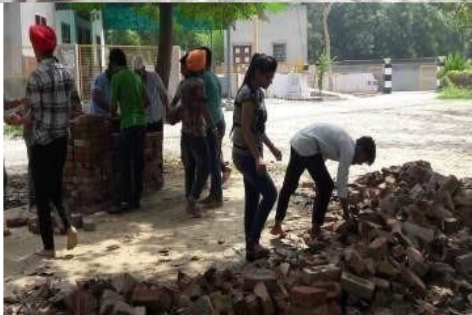
Volunteers during the Cleanliness Drive at Dera Baba SidhTilkara, Deon