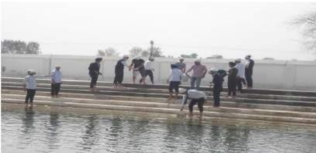
Cleanliness Camp at Gurudwara Thehri Sahib, Malout: Volunteers during the cleanliness of Gurudwara Sarovar Sahib