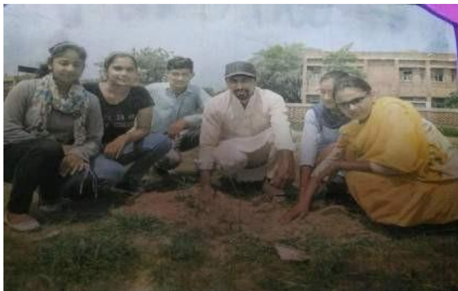
Volunteers planting the Trees in the village Makha