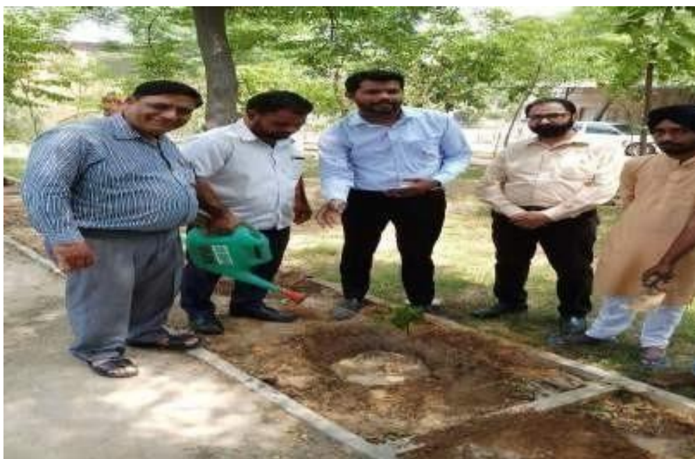
Volunteers planting the saplings in the village with help of the Local Residents