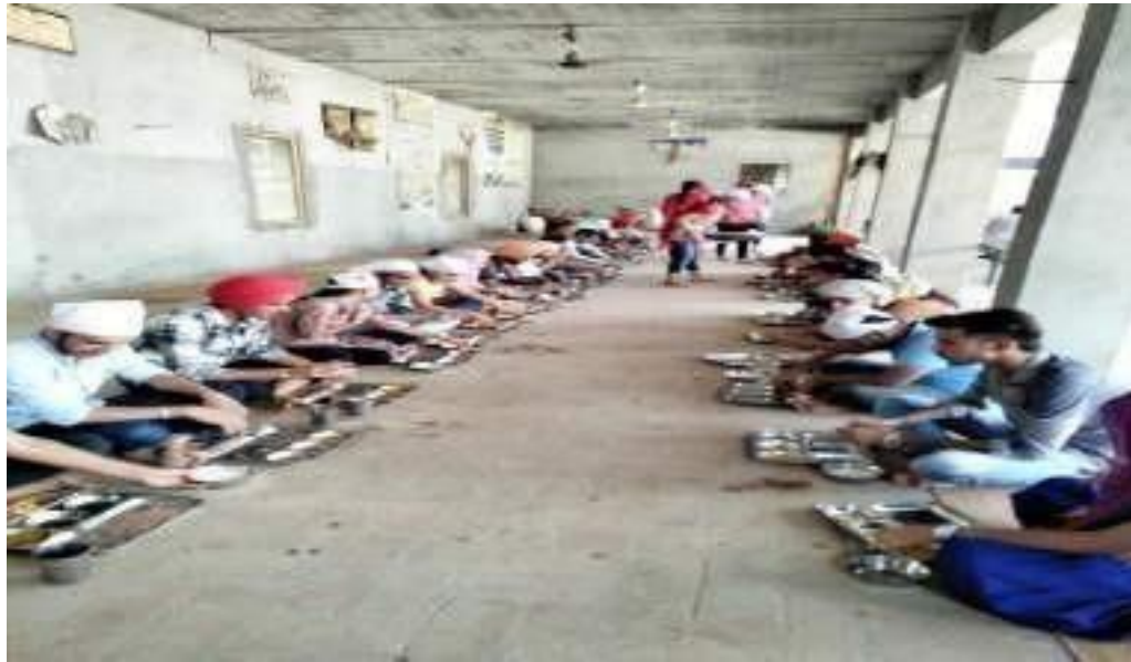
Volunteers serving the Guru Ka Langar in the Langar Hall of Dera Baba SidhTilkara, Deon