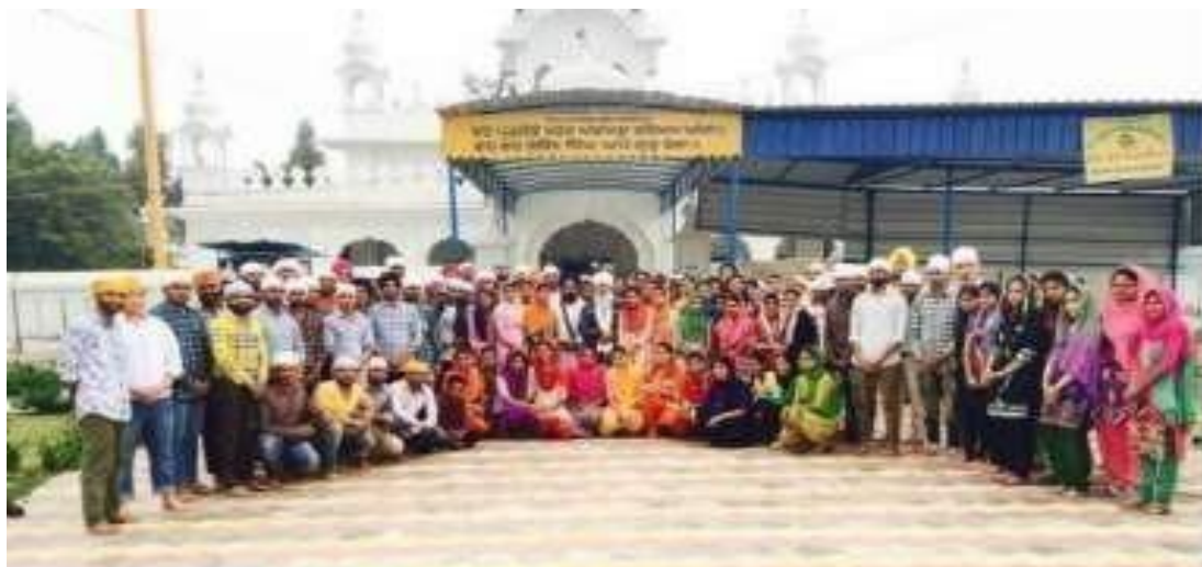
Cleanliness Camp at Gurudwara Thehri Sahib, Malout: Volunteers who participated in this Cleanliness Drive