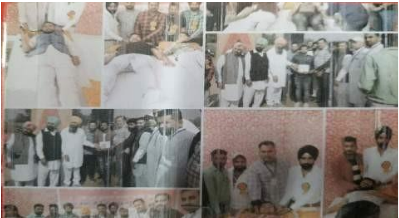
Glimpses of Blood Donation Camp at Village Daula