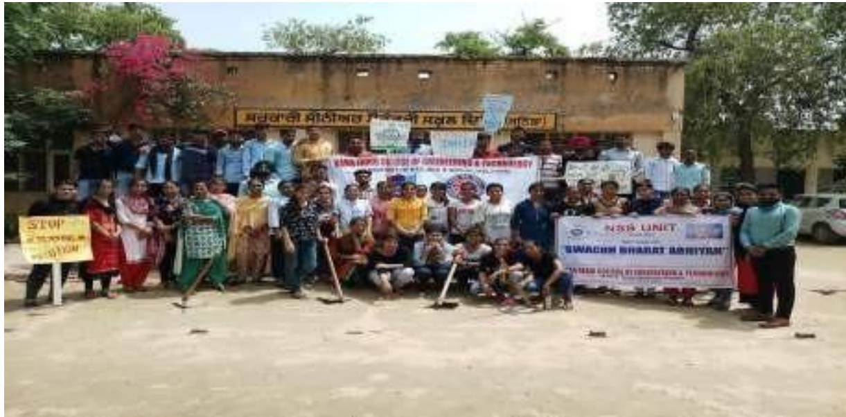
Volunteers after executing the Activity along with the school students