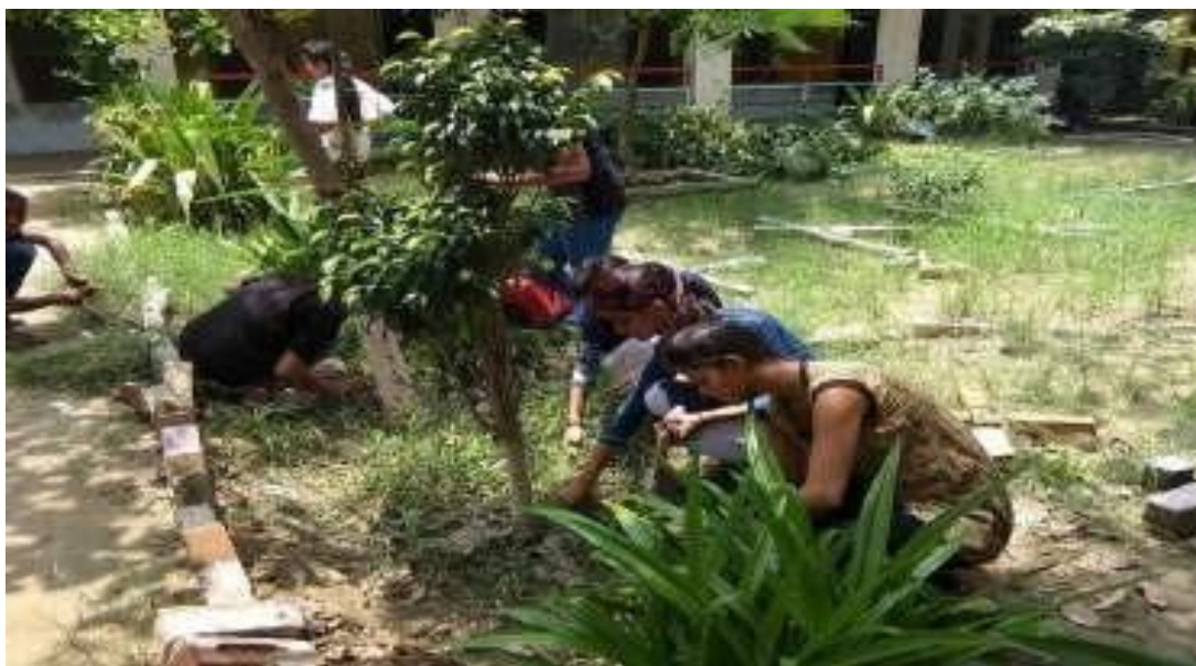
NCC Volunteers focusing on the need of maintaining Swachhta at Govt. Sen. Sec. School, Deon